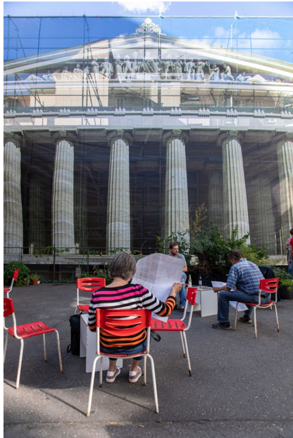
Das Foyer – Das Deutsch Eine Standortbestimmung, von Christoph Ernst

zeitraumexit / Hafenstrasse 68 / Mannheim